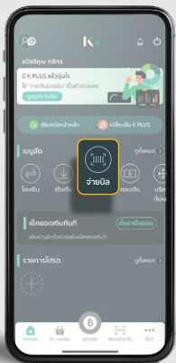
1. เลือกเมนู "จ่ายบิล"

ท่านสามารถชำระค่าวงวด เงินให้ใจ สินเช็อรถช่วยได้ บน K PLUS ตามวิธีการ ดังนี้