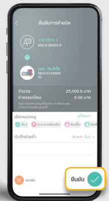
4. ตรวจสอบข้อมูล และกด "ยืนยัน"

หากท่านมีข้อสงสัย หรือต้องการสอบถามข้อมูลเพิ่มเติม ท่านสามารถติดต่อเงินให้ใจได้ ผ่านช่องทาง Call Center โทร 02-078-8899 วันจันทร์-วันเสาร์ เวลา 8.30 - 17.30 น. และ LINE Official Account: @ngernhaijai